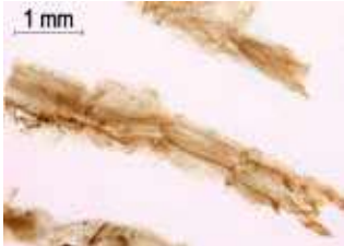
● Resten van dansmugpoppen onder de stereomicroscop.