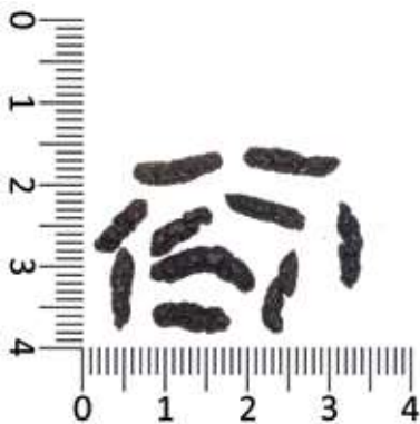
● Keutels van de meervleermuis.